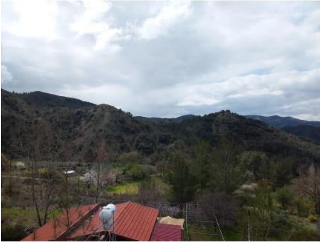
Η ευρύτερη περιοχή του εξεταζόμενου τεμαχίου 202.