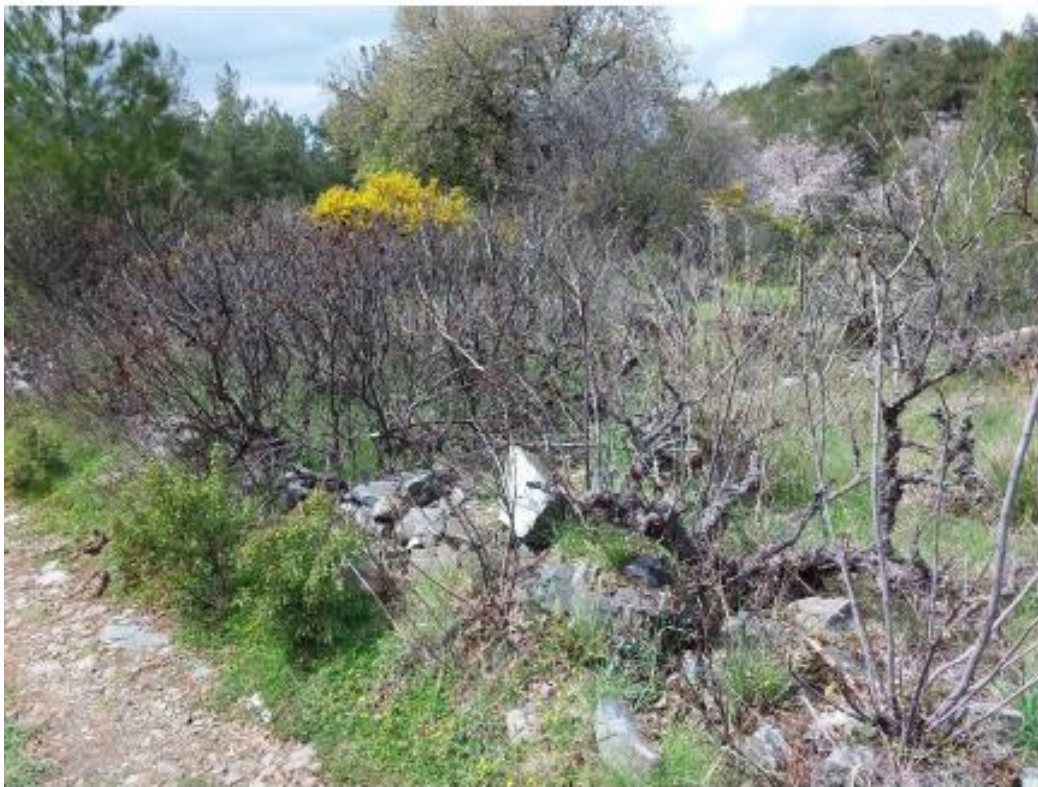
Μέρος του υπό εκτίμηση τεμαχίου 2046.