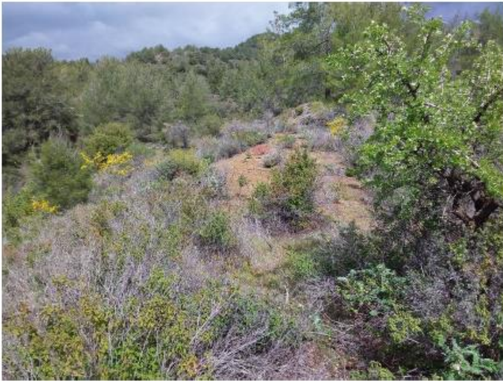
Μέρος του υπό εκτίμηση τεμάχιου 1266.